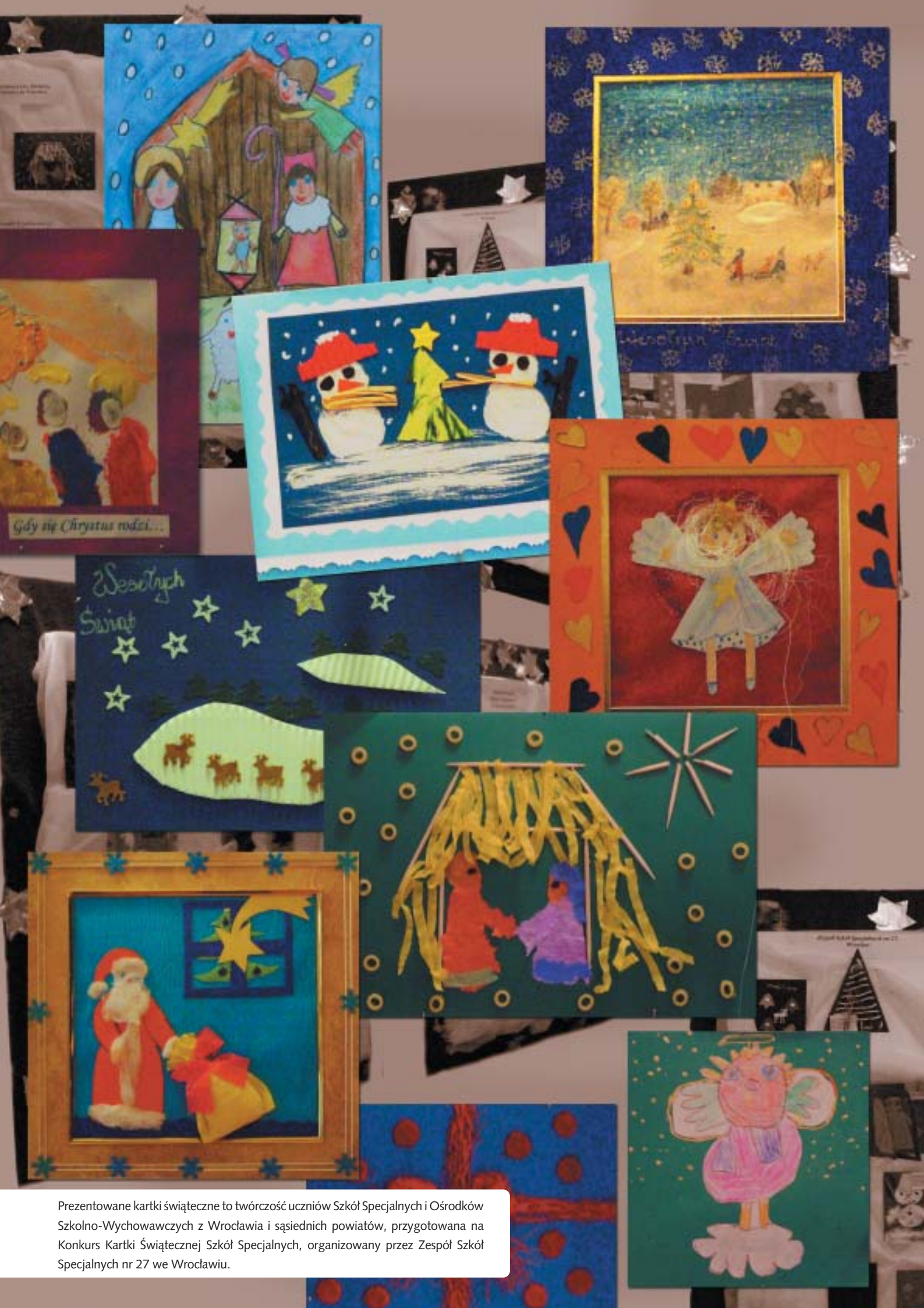
Prezentowane kartki świąteczne to twórczość uczniów Szkół Specjalnych i Ośrodków Szkolno-Wychowawczych z Wrocławia i sąsiednich powiatów, przygotowana na Konkurs Kartki Świątecznej Szkół Specjalnych, organizowany przez Zespół Szkół Specjalnych nr 27 we Wrocławiu.