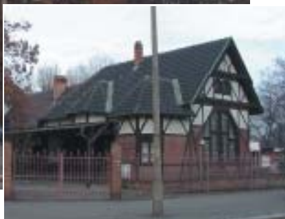
Na górze: Pomnik Zesłańców Sybiru Obok: Kościół p.w. św. Bonifacego, kamienica na placu Strzeleckim oraz budynek dawnej stacji kolejki wąskotorowej