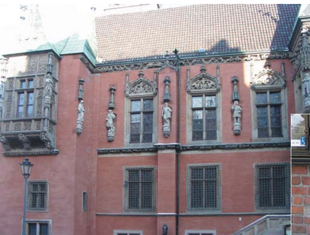
Na górze: Ratusz – fasada wschodnia