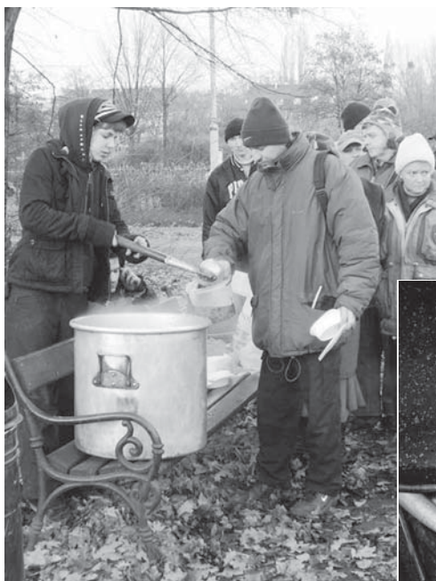
Niedziela na pl. Staszica