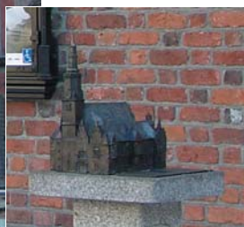
Obok: Ratusz – fragment fasady południowej oraz model ratusza