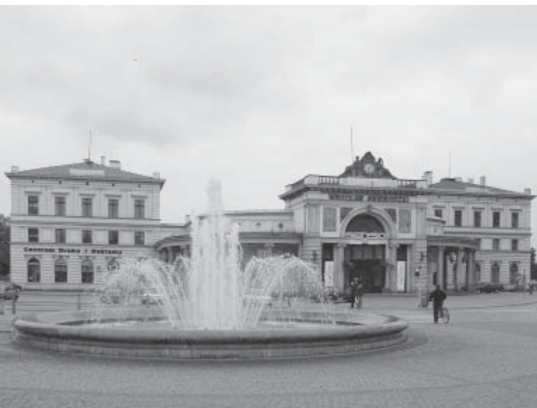
Na górze: Podwale – dawne koszary kirasjerów, w głębi gmach sądu Obok: Dworzec Świebodzki

Powoli dochodzimy do placu Orłąt Lwowskich. Odsłania się przed nami widok dawnego Dworca Świebodzkiego. Ostatni pociąg odjechał stąd w 1992 roku, po prawie 150 latach kursowania na trasie Wrocław-Świebodzice, potem dalej do Wałbrzycha i Jeleniej Góry. Budynek dworca powstał w 1842 roku w stylu późnoklasycystycznym, a późniejsza przebudowa, m.in. według projektu Karla Lüdeckego, autora gmachu Nowej Giełdy przy Krupniczej, uczyniła z niego okazałą budowlę. Obecnie pomieszczenia dworca zaadaptowano na scenę teatralną, klub oraz sklepy, jednak wszystko to ma dość przypadkowy charakter. Na pewno przydałby się jakiś udany pomysł na spójne wykorzystanie tego pięknego obiektu. Zwłaszcza, że wkrótce od strony placu Orłąt Lwowskich pojawi się nad fosą kładka, dzięki której z okolic Dworca Świebodzkiego szybko dostaniemy się do ścisłego centrum miasta. Możliwe, że uda się w końcu zrealizować zamierzenia magistratu, aby odnowić i unowocześnić dworzec, czyniąc z niego kolejny ważny węzeł przesiadkowy. Moglibyśmy stąd m.in. dojechać pociągiem do lotniska.